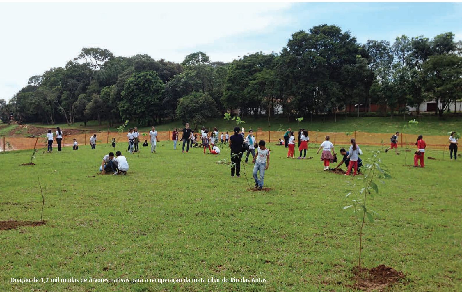
Doação de 1,2 mil mudas de árvores nativas para a recuperação da mata ciliar do Rio das Antas